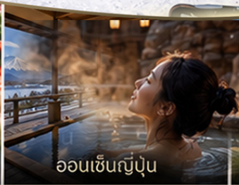
ออนเซ็นญี่ปุ่น