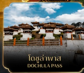
โดจุลาพาส DOCHULA PASS