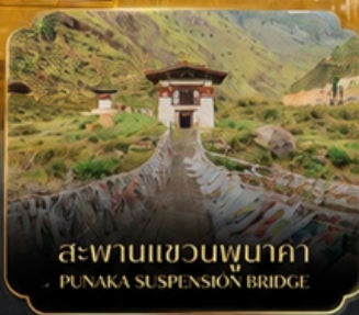
สะพานแขวนพุนาคา PUNAKA SUSPENSION BRIDGE