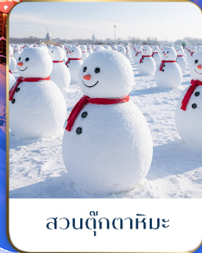
สวนตุ๊กตาหิมะ