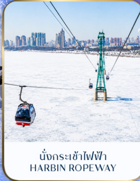
นั่งกระเช้าไฟฟ้า HARBIN ROPEWAY