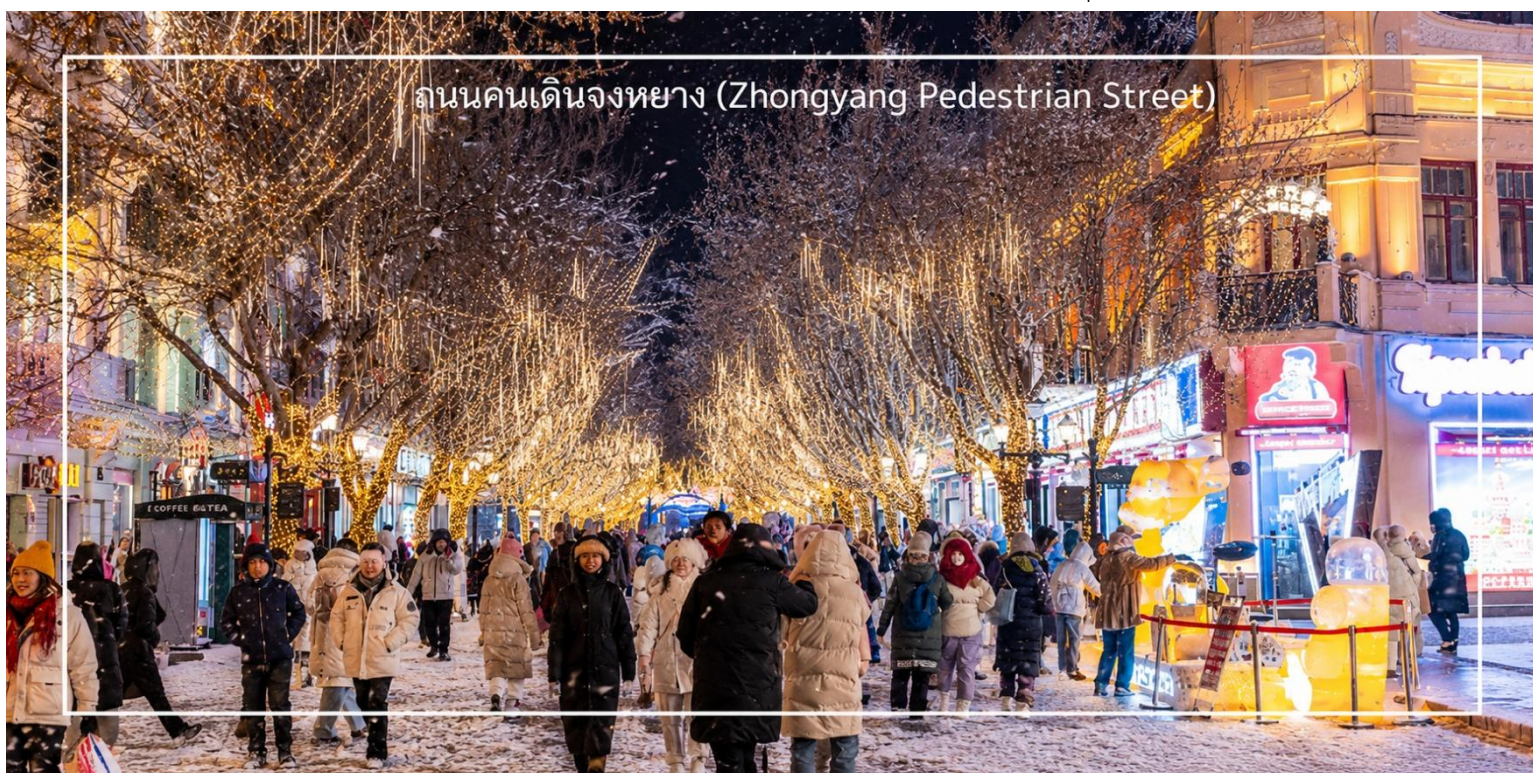
ถนนคนเดินจงหยาง (Zhongyang Pedestrian Street)

ให้ท่านอิสระช้อปปิ้ง ถนนคนเดินจงหยาง (Zhongyang Pedestrian Street) ถนนคนเดินชื่อดังของฮาร์บิน แหล่งรวมสินค้าท้องถิ่น ร้านค้า คาเฟ่ ร้านอาหาร เสื้อผ้า แฟชั่น รองเท้าและของฝากหลากหลายสไตล์ บรรยากาศยุโรปและจีนที่ผสมผสานได้อย่างลงตัว แวะชม Popmart เก็บคอลเลคชั่นใหม่ ๆ ของฟิกเกอร์สุดน่ารัก ที่สายสะสมของเล่นไม่ควรพลาด