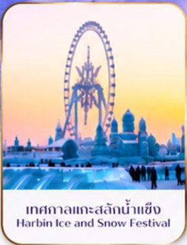
เทศกาลแกะสลักน้ำแข็ง Harbin Ice and Snow Festival

คอนเฟิร์มออกเดินทาง ตั้งแต่ 15 วัน ขึ้นไป