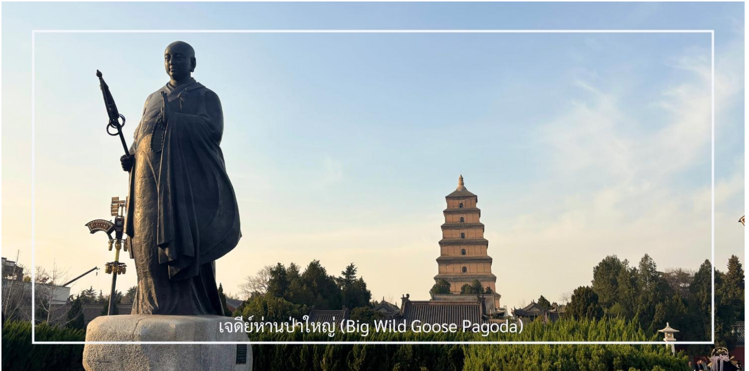
เจดีย์ห่านป่าใหญ่ (Big Wild Goose Pagoda)

นำท่านเดินทางสู่ เจดีย์ห่านป่าใหญ่ (Big Wild Goose Pagoda) ซึ่งตั้งอยู่ภายในบริเวณ วัดต้าซือเอิน (Da Ci'en Temple) สถานที่สำคัญทางพุทธศาสนาและประวัติศาสตร์ของจีน สร้างขึ้นในปี ค.ศ. 652 สมัยราชวงศ์ถัง เพื่อเก็บรักษาพระไตรปิฎกและพระธรรมคัมภีร์ที่ พระถังซำจั๋ง อัญเชิญกลับจากชมพูทวีป เจดีย์มีลักษณะทรงสี่เหลี่ยมแบบขั้นบันได สร้างด้วยอิฐเผา สะท้อนศิลปะจีนที่ผสมอิทธิพลจากอินเดีย เดิมสูง 5 ชั้น ต่อมาได้รับการบูรณะจนมีความสูง 7 ชั้น (ประมาณ 64 เมตร) เป็นแบบอย่างของสถาปัตยกรรมพุทธศิลป์ุคราชวงศ์ถังที่เรียบง่ายแต่ทรงพลัง ปัจจุบันเจดีย์แห่งนี้ถือเป็นสัญลักษณ์ทางวัฒนธรรมของเมืองซีอานและสถานที่ท่องเที่ยวยอดนิยมที่ควรมาเยือน