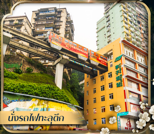
นั่งรถไฟกะลุดัก

คอนเฟิร์มออกเดินทาง ตั้งแต่ 10 ท่าน ขึ้นไป