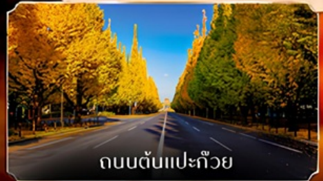
ถนนต้นแปะก๊วย