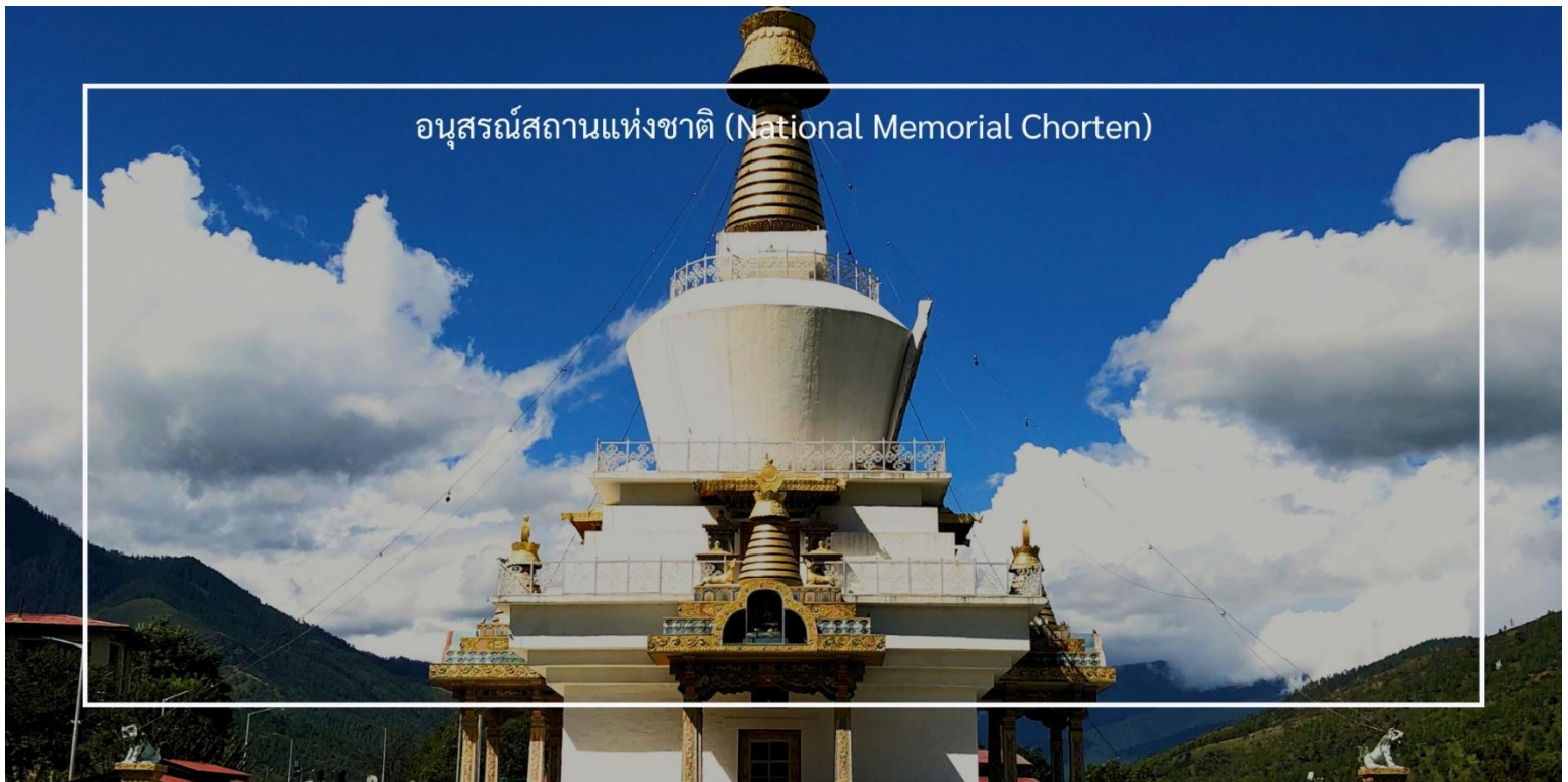
อนุสรณ์สถานแห่งชาติ (National Memorial Chorten)

เที่ยวชม อนุสรณ์สถาน Memorial Chorten หรือที่รู้จักกันในชื่อ Chorten เป็นอนุสรณ์สถานที่สำคัญในเมืองทิมพู (Thimphu) ประเทศภูฏาน สร้างขึ้นเพื่อเป็นเกียรติแก่กษัตริย์ Jigme Dorji Wangchuck ซึ่งเป็นพระมหากษัตริย์องค์ที่สามของภูฏาน มีการออกแบบที่เป็นเอกลักษณ์ในสไตล์ภูฏาน โดยมีโดมกลมใหญ่และลวดลายที่สวยงาม ทำให้เป็นจุดเด่นในทิมพู อนุสรณ์สถานนี้เป็นสถานที่ที่พระสงฆ์และประชาชนมานั่งทำสมาธิและสวดมนต์ โดยมีการหมุน กรงล้อมนตรา (prayer wheel) รอบๆ เพื่อทำให้เกิดความสงบและเสริมสร้างพลังทางจิตใจ สร้างขึ้นในปี 1974 เพื่อเป็นอนุสรณ์แก่กษัตริย์ ผู้ซึ่งมีบทบาทสำคัญในการพัฒนาประเทศและการสร้างสันติภาพในภูฏาน ตั้งอยู่ใกล้กับใจกลางเมืองทิมพู ทำให้สามารถเข้าถึงได้ง่ายและสะดวกสำหรับนักท่องเที่ยว