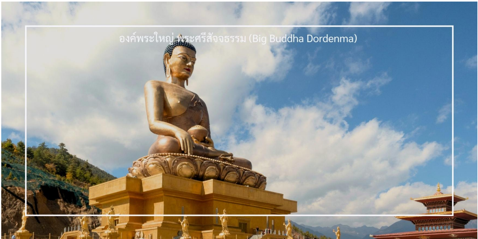
องค์พระใหญ่ พระศรีสัจธรรม (Big Buddha Dordenma)

เที่ยวชม องค์พระใหญ่ พระศรีสัจธรรม (Big Buddha Dordenma) เป็นพระพุทธรูปที่มีความสูงถึง 51 เมตร ตั้งอยู่บนยอดเขาในเมืองทิมพู (Thimphu) ประเทศภูฏาน พระพุทธรูปนี้เป็นหนึ่งในพระพุทธรูปที่ใหญ่ที่สุดในโลก