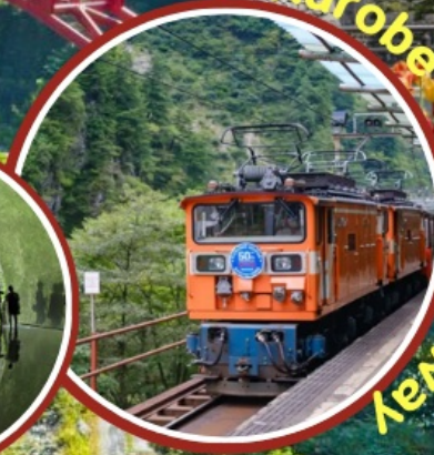
Kurobe Gorge Railway