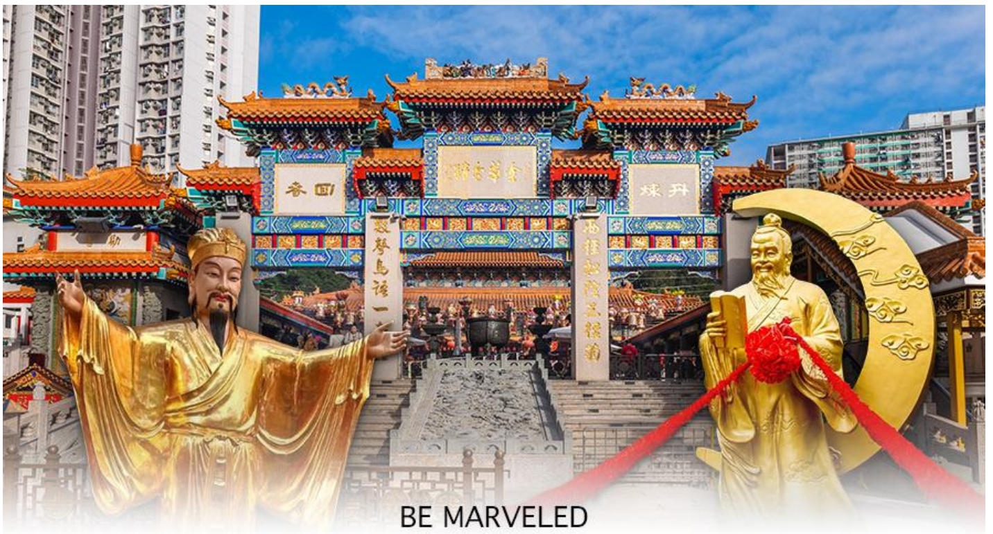
BE MARVELED วัดหว่องต้าเซียน

ให้ วัดหว่องไท่ซิน นั้น มีชื่อเสียงโด่งดังขึ้นมา ก็เพราะ พระหวังต้าเซียน หรือที่รู้จักกันในชื่อ ฮวงซูปิง (Huang Chu-ping) ในช่วงประมาณศตวรรษที่ 4 ได้เดินทางจากเมืองจินมาเผยแผ่ศาสนาในฮ่องกง และสร้างวัดแห่งนี้ขึ้นมาเมื่อประมาณปีค.ศ. 1921 ค่ะ ภายในวัดจะมีทั้ง เทพเจ้าหวังต้าเซียน, เจ้าแม่กวนอิม, เจ้าที่, เทพเจ้าหยุกโหลว (เทพเจ้าแห่งความรัก), ท่านขงจื้อ ซึ่งคนฮ่องกงเอง และนักท่องเที่ยวก็จะมาราบไหว้เพื่อสิริมงคลกัน โดยเฉพาะอย่างยิ่งคือ เทพเจ้าหยุกโหลว หรือ เทพเจ้าแห่งความรัก ที่เราเรียกกันว่า เทพเจ้าด้ายแดง เป็นพิภพที่หลายๆ คนมักจะไปขอความรักจากท่านกัน นอกจากนี้ที่เราจะต้องเอาด้ายแดงมาพันมือนี้นะ ตามป้ายที่แนะนำข้างหน้าแล้ว ใก้ นำเที่ยวคนฮ่องกงบอกว่าถ้าเป็นผู้หญิงอย่างเราอยากได้แฟน ก็ต้องไปผูกด้ายที่รูปปั้นผู้ชายและพอไหว้เสร็จแล้วก็อย่าลืมหยอดทำบุญใส่ตู้ไปด้วย