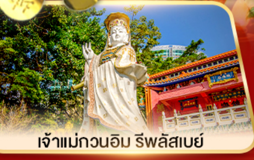
เจ้าแม่กวนอิม ธิพลสมัย