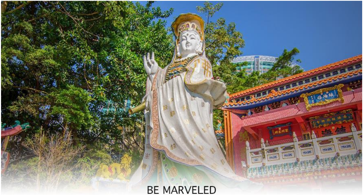
BE MARVELED วัดเจ้าแม่กวนอิมริปลัสเบย์

จากนั้นนำท่านเดินทางสู่ วัดหลินฟ้า (LIN FA KUNG TEMPLE) วัดหลินฟ้ากอยู่ในย่านหว่านใจ ตั้งอยู่บนเนินเขาหันหน้าออกสู่ทะเลทางทิศตะวันออกเฉียงใต้ของอ่าวคอสเวย์ ถึงแม้จะเป็นวัดเล็ก ๆ แต่วัดหลินฟ้า คือวัดเก่าแก่ที่มีประวัติความเป็นมาเกี่ยวข้องกับความศักดิ์สิทธิ์ของเจ้าแม่กวนอิมโดยตรงวัดนี้ตั้งอยู่บนถนนลิลี สตรีท (Lily St.) ที่เชื่อมต่อกับถนน Lin Fa Kung ตามชื่อวัดหลินฟ้า ตำนานเล่าว่า ในสมัยราชวงศ์ซิง เจ้าแม่กวนอิม หรือพระโพธิสัตว์กวนอิม ซึ่งเป็นเทพีแห่งความเมตตา ได้ปรากฏกายขึ้นบนโขดหินรูปดอกบัว (Lotus Rock) ณ บริเวณที่ตั้งของวัดในปัจจุบัน ชาวบ้านเชื่อว่าการปรากฏกายของเจ้าแม่กวนอิมเป็นสัญลักษณ์ของความโชคดีและการคุ้มครองจากภัยพิบัติต่างๆ จากจุดนี้ เราสามารถเดินเล่นเดินเที่ยว ต่อไปยังถนนเส้นอื่น ๆ ได้ง่าย ตลอดเส้นทาง ทำให้วัดหลินฟ้า หรือ หลินฟ้าก (Lin Fa Kung) แห่งนี้ อยู่ในจุดที่นักท่องเที่ยวสามารถเข้ามาไหว้ขอพรเจ้าแม่กวนอิมวังดอกบัวได้สะดวก