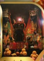
วัดบ้านใหม่