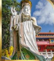
เจ้าแม่กวนอิม รัชลิสเบย์