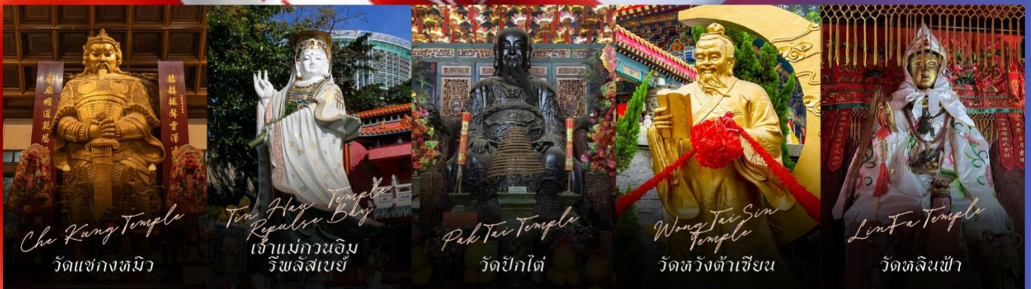
Che Kung Temple วัดแซงกหมีว

รายการทัวร์ข้างต้นอาจมีการปรับเปลี่ยนเพื่อความเหมาะสม