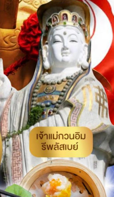
เจ้าแม่กวนอิม รัชลิสเบย์