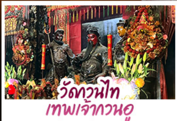
วัดหนาท เทพเจ้ากวนอู