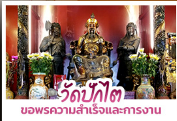
วัดปักโก๊ต ขอพรความสำเร็จและการทำงาน