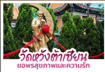
วัดเข่งต้าเซียน ขอพรสุขภาพและความรัก