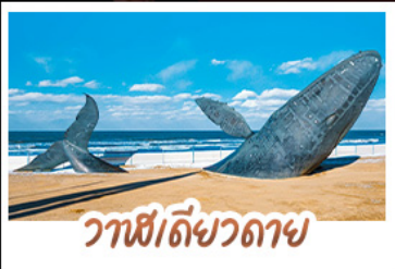
วาฬดี๊วตาช