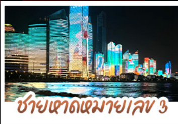
ซ่ามเขตเดมาจเลข 3