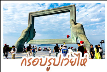
กรอบรูปเว่ยไฉ่

ถ่ายรูปย่านเมืองเก่าสไตลียอร์ม • โบสถ์เซนต์ไมเคิล และย่านปาด้ากวน พร้อมทัวร์พิพิธภัณฑ์โรงเบียร์ชิงเต่าระดับตำนาน ฟรี! ซิมเบียร์สดท่านละ 1 แก้ว เช็คอินมมมหาชนฟีลอินที่ถนนคนเดินเฟื่องสายที่ 8 • แวะถ่ายรูปสุดอาร์ตกับ ซากเรือลูวอี้ • ตกค่ำตะลุยกินที่ตลาดสไตลียอร์ม ถนนอันเลื่องชื่อ ที่ยิวฮิสเตอร์รี่โซน จัดสรรเวลาให้ท่านด้วยวัน FREE DAY 1 วันเต็มในชิงเต่า