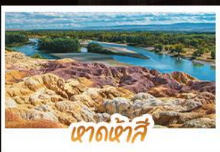
เขาดงเคาซี