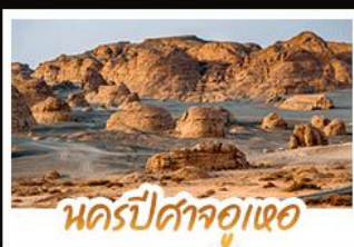
นครปีศาจอูเออ

หนาวนี้ที่ซินเจียง เราเลือกความงามสุดอลังการของอุทยานคานาสีอู๋ เก็บภาพสวยครบทุกพีค ทั้งศาลาขมปลา อ่าวเสี้ยวจินตรา อ่าวซอ่มังกร และอ่าวเทพทเวด้า • นอนพักค้างคืนในกระท่อมไม้ ภายในหมู่บ้านเหม่บู๋ ตีบเข้ามาสู่อากาศบริสุทธิ์และทัศนียภาพหมู่บ้านที่ถูกหิมะปกคลุมราวกับเมืองในฝัน นังกรไฟซมวิวนครปีศาจอุเทอ • ซ้อมปีนของฝากทีละตาแกรนด์บาซาร์ เมืองอู๋มู่ฉี