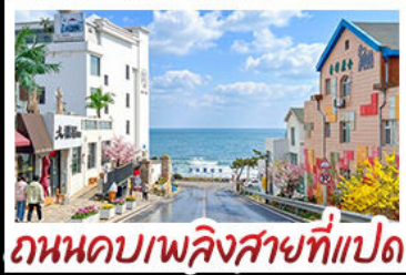
ถนนคอบาเพลิ่งสายที่แปด