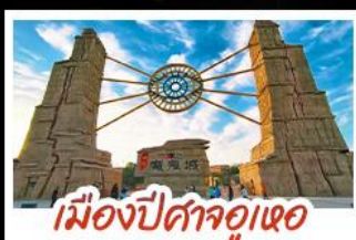
เมืองปีศาจอุเออ