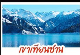
เขาเทียนชาน