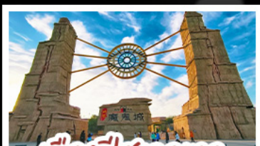
เมืองปศาจอุเออ