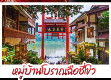
หมู่บ้านโบราณฉือชี่ไว๋