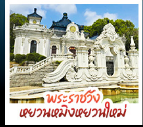
พระราชวัง เฉยวณเจมิงเฉยวณใหม่