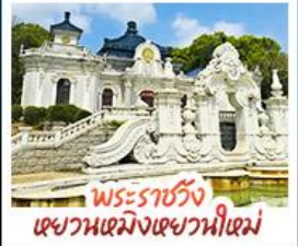
พระราชวัง เขยวนเหมิงเขยวนหนี่เหม