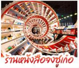
ร้านหนังสือจุงซูเกอ