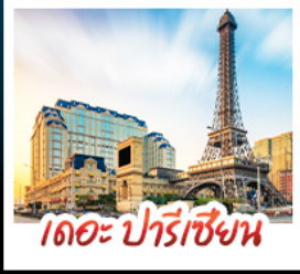
เดอะ ปารีสเซียน

สัมผัสบรรยากาศ เดอะ เวนเซียน มาเก๊า เสมือนได้เยือนลาสเวกัส ชมความวิจิตรตระการตาของพระราชวังหยวนหมิงหยวนใหม่แห่งจูไห่ เช็กอินกับแลนด์มาร์กสุดฮิตจตุรัสสวาเอ็งถ่ายรูปแบบทิวทัศน์ของกวางเจา เที่ยวชมหมู่บ้านสไตล์ยุโรปแห่งใหม่ของเซนจิน • ช้อปปิ้งเพลิน ๆ ที่ห้างสรรพสินค้า COCO PARK ถนนคนเดินฟู้หัวหลี่และถนนคนเดินปิกกิง