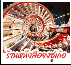
ร้านหนังสือจุงชูก่อ