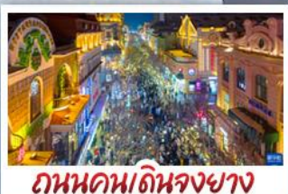
ถนนคนเดินจงยาง