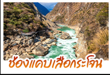
ช่องแคบเสื่อกระเจิง

ชมโค้ง S ทะเลสาบเออร์โห่ พร้อมจุดถ่ายรูปชิคๆ • สัมผัสประสบการณ์ ชมวิวบนรถไฟแบบพาโนรามาที่ LIJIANG SNOW MOUNTAIN SIGHTSEEING TRAIN • ชมโชว์ IMPRESSION LIJIANG เมืองโบราณมีซากโบราณสถานพญาคันคัง (รวมค่าเครื่องคิมท้านละ 1 แท่ง) นั่งรถไฟความเร็วสูง 1 แท่ง จากลี่เจียงกลับสู่คุนหมิง เติมน้ำมันห้องนั่งของฝากคน ถนนหนทางดีเยี่ยม ประตุน้ำทองใต้หยก