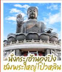
นั่งกระเช้ามองปิง ชมพระใหญ่โป้วหลิน

นั่งกระเช้ามองปิงสักการะพระใหญ่โป้วหลิน • วัดหวังต้าเซียน ขอพรสุขภาพ ความรัก วัดเข่งหมิว ขอพรองค์เซกซุ ซิคลาก การเงินและธุรกิจ • เจ้าแม่กวนอิมรีฟาส์เบย์ รับพลังงานดี เสริมพลังฮวงจุ้ย • วัดหมิ่นโหมว ขอพรเรื่องการศึกษ การงาน สติปัญญาและความกล้าหาญ