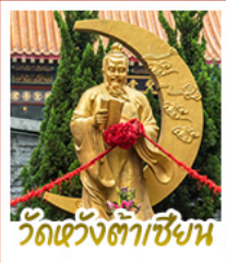
วัดเว้งต้าเซียน