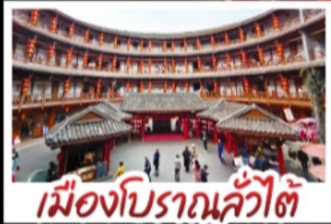
เมืองโบราณลั่วใต้