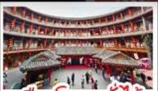
เมืองโบราณลั่วใต้