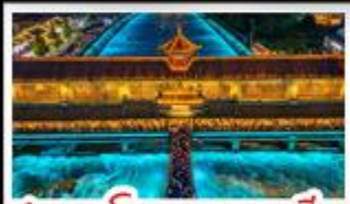
สะพานโบราณหนวยธิยว

อุทยบคำกู่ปิงชวณ - อุทยบสี่ดรุณี - หมี่แพนด้าอนเซลฟี่ น้ำพินันตีกSKP - อุทยบปีผึ้งโกว - สะพานโบราณหนวยธิยว สตรีทอาร์ต Eastern Suburb Memory - เมืองโบราณลั่วใต้ เบมูพิศษ หม้อโพหนาล่า