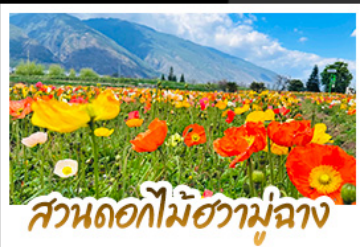
สวนดอกไม้ฮวามู๋ตาง