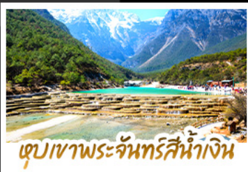
เขื่อนเขาพระจันทร์สีน้ำเงิน