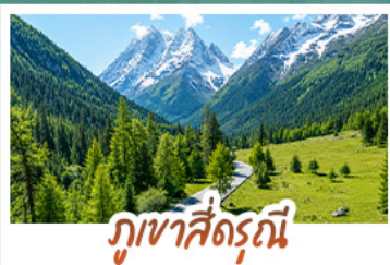
ภูเขาสัตว์จีน