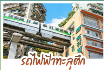
รถไฟฟ้าที่คุตตีง

ชมธรรมชาติ ณ อู่หลง ชมหุบเขาสุดอลังการระดับมรดกโลก นั่งรถไฟฟ้าที่สวยที่สุดหือจ้อป้า สัญลักษณ์เมืองจงชิ่งสุดล้ำ สัมผัสวิถีภูเขาหิมะแห่ง ภูเขาสัตว์จีน งดงามจนได้รับฉายา "เทือกเขาแอลป์แห่งตะวันออก" ชมธรรมชาติสุดฟิน ณ อุทยานป่าเผิงโกว • ซ้อป๋องจู่ใจ ถนนคนเดินไท่กู่หลี่, ถนนคนเดินซุนชื้อ