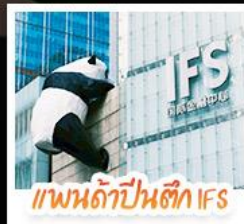
แพนด้าปาร์ค IFS