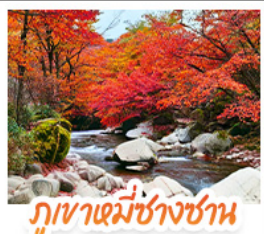
ภูเขามะขางซาน