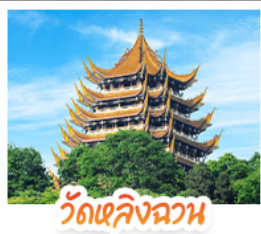
วัดเลิ่งฉวน