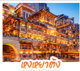
แดงหยาดัง