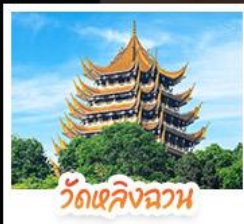
วัดเลิ่งอว่น