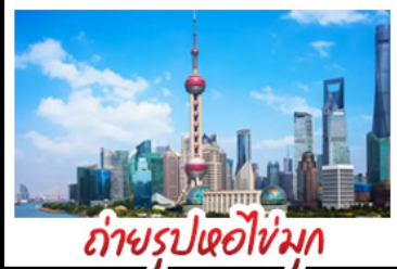
ถ่ายรูปตอโม่ทุก