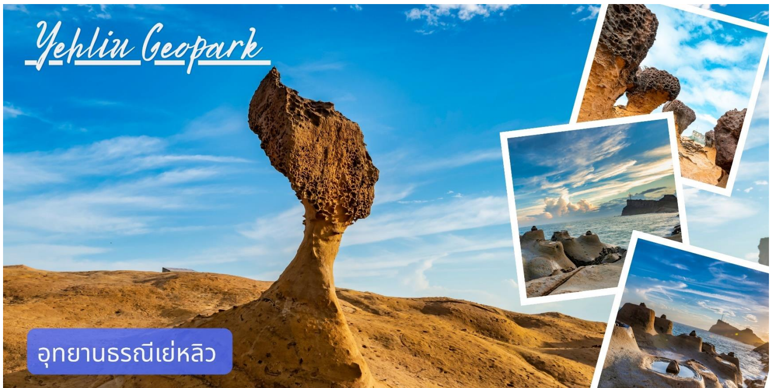
อุทยานธรณีเยหลิว

สัมผัสประติมากรรมทางธรรมชาติที่ใช้เวลารังสรรค์นานนับล้านปี ณ อุทยานธรณีเยหลิว (Yehliu Geopark) เมืองนิวไทเป แหลมขนาดเล็กที่ยื่นออกไปในทะเล พร้อมต้นตากับหินรูปร่างแปลกตาที่เกิดจากการกัดเซาะของลมและคลื่น โดยเฉพาะ 'หินเศียรราชินี' แลนด์มาร์กอันล้ำค่าที่ห้ามพลาด เดินเล่นท่ามกลางโขดหินรูปเห็ดและพื้นผิวโลกที่ดูราวกับดาวเคราะห์ดวงอื่น ที่ทุกอย่างก้าวจะทำให้คุณทึ่งในความงามของชั้นหินและสีครามของคาบสมุทรไต้หวัน เป็นจุดเช็คอินที่รวมทั้งความอาร์ตและความยิ่งใหญ่ของธรรมชาติไว้ในทีเดียว