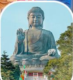
พระใหญ่โป้วหลิน