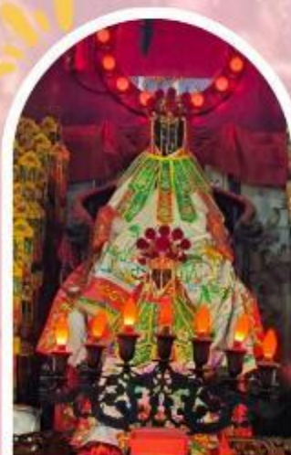
วัดเจ้าแม่กวนอิมฮ่องกง ขอพรเรื่องเงิน ทรัพย์สิน และความมั่งคั่ง