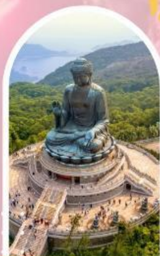
นั่งกระเช้ามองปิง นมัสการพระใหญ่โปวหลิน