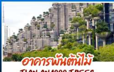
อาคารพันต้นไม้อันเทียน TIAN AN 1000 TREES