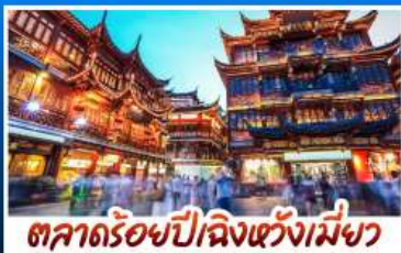
ตลาคตร้อยปีริมตลิ่งเซี่ยงไฮ้