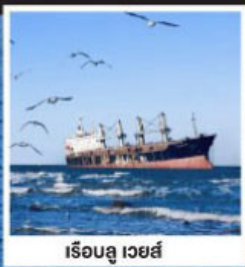
เรือซู เวย์ส์