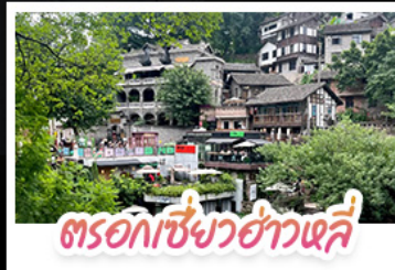
ตรอกเซี่ยวฮ่าวเสี