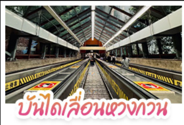
บันไดเลื่อนแขวงทวน