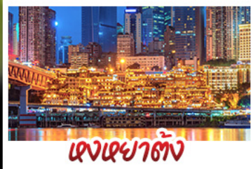
เจดีย์ต้าเจี๋ย