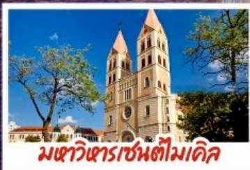
มหาวิหารเซนต์โมเกิล