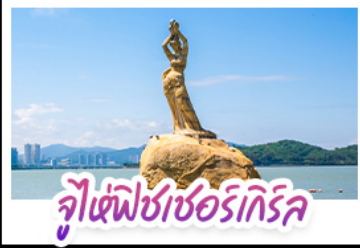
จูเซ่ฟิเชอร์ริกริล