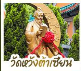
วัดแะวังถ้ำเซ็งน