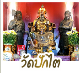
วัดปี้กั้โต