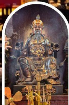
วัดปักโต

ขอเทพเจ้ากวนอู ความซื่อสัตย์ เงินทอง ธุรกิจมั่นคง