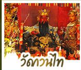
วัดกวนน้ท