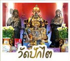
วัดป้กไค