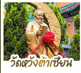
วัดเข้ว้งต้าเซี๊ยน