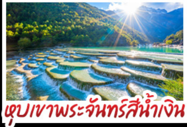
เขื่อนเขาพระจันทร์สีน้ำเงิน