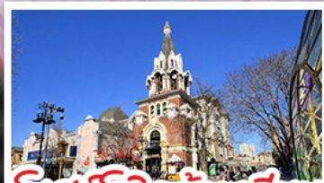
โบสถ์โกธิคต้าเหลียน