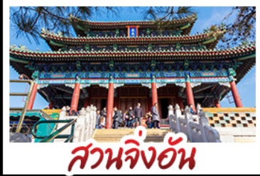
สวนจิ้งอัน