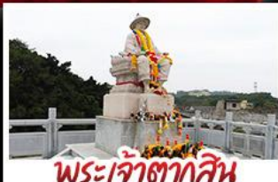
พระเจ้าตากสิน