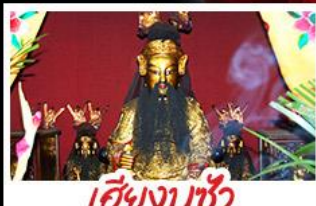
เอียงบูชิว