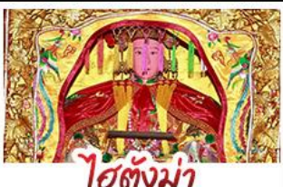
ไต้ตังมา

มรดกโลกบ้านดินถู่โหลวเตียนโหลวเคิง - สะพานเซียงจิว ไต้ตังมา (เจ้าแม่กบกับทิม) - เอียงบูชิว (เจ้าพ่อเสือ) พระเจ้าตากสินมหาราช - อวนน้ำแร่จากธรรมชาติ ไม้ลงร้านซ้อป - พักโรงแรม 4 ดาว เมนูพิเศษ!!! อาหารแต้จิว 18 อย่าง, สุกีชีฟู้ด ห่านพะไล่ตันตำรับแต้จิว