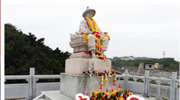
พระเจ้าตากสิน