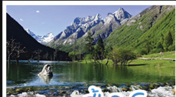
อุทยานปี้เผิงโกว