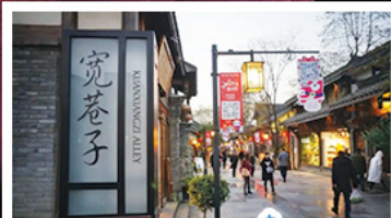
ถนนควานจ้าย