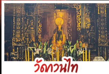
วัดกวนหนี่ท