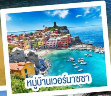
หมู่บ้านเวอร์นาซซา