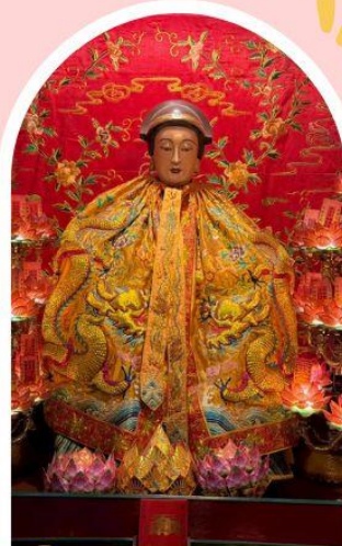
วัดหล่งโหมว

ความสำเร็จ ความมั่งคั่ง เงินทองไหลมาเทมา