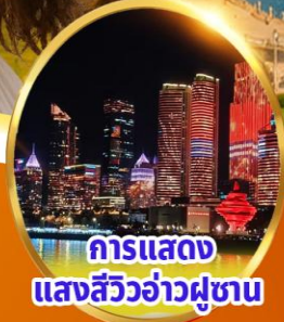
การแสดงแสงสีว้าวคู่ขนาน