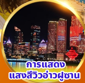
การแสดงแสงสีว้าวฟูซาน