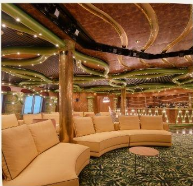
Minerva Piano Bar