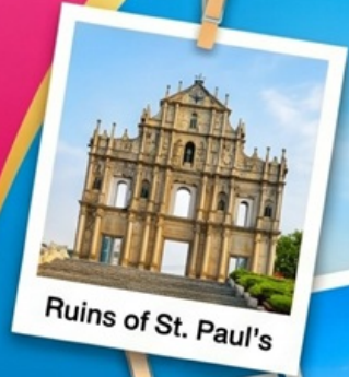
Ruins of St. Paul's