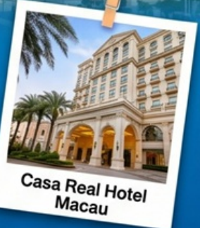
Casa Real Hotel Macao

แพ็คเกจสุดคุ้ม พักรู 4 ดาวพร้อมอาหารเช้าที่ Casa Real Hotel Macau