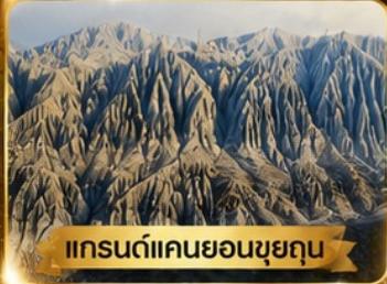
แกรนด์แคนยอนขุยคุน