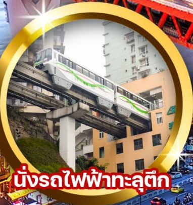
นั่งรถไฟฟ้าทะเลตุ๊ก