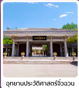
อุทยานประวัติศาสตร์จี้วจวน

อาหารมื้อพิเศษ ใต้ต้นหม้อไอน้ำ ซีโครงหมูสัโตะลิกันโจว